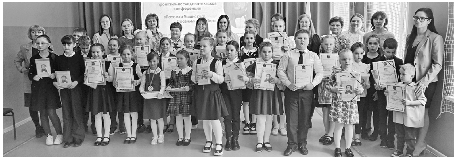
Участники конференции с заслуженными наградами

Благодарим всех участников и педагогов за не дающую покоя жажду поиска, открытий и вдохновения!