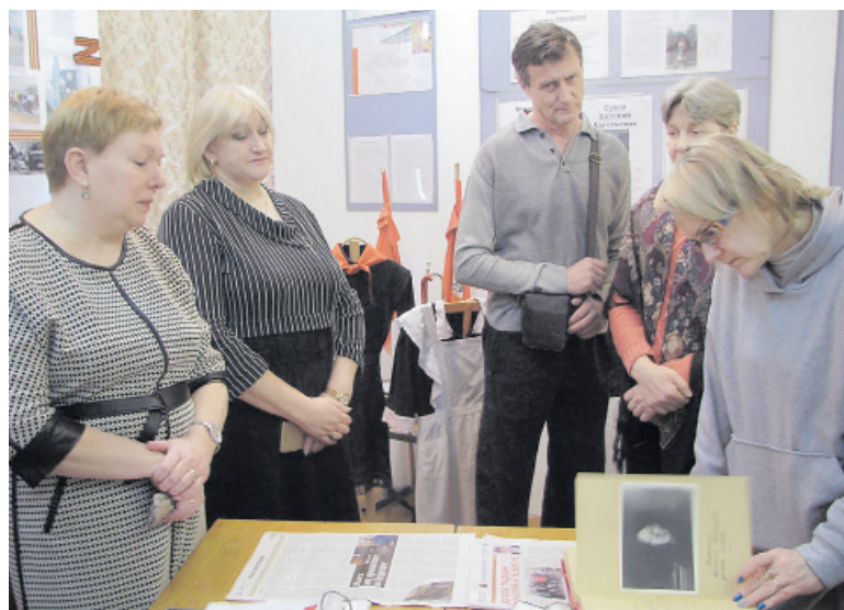
Гости знакомятся с экспонатами музея

фии, находят на них своих бабушек, дедушек, родителей.