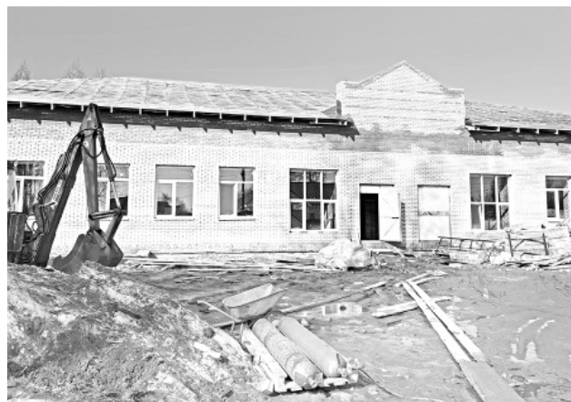
Будущий многофункциональный центр в д. Пестрецово

Возле того и другого модульных сооружений осталось провести качественное благоустройство территории, что и будет выполнено в согласованные сроки.