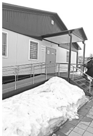
Поликлиника в д. Ноготино