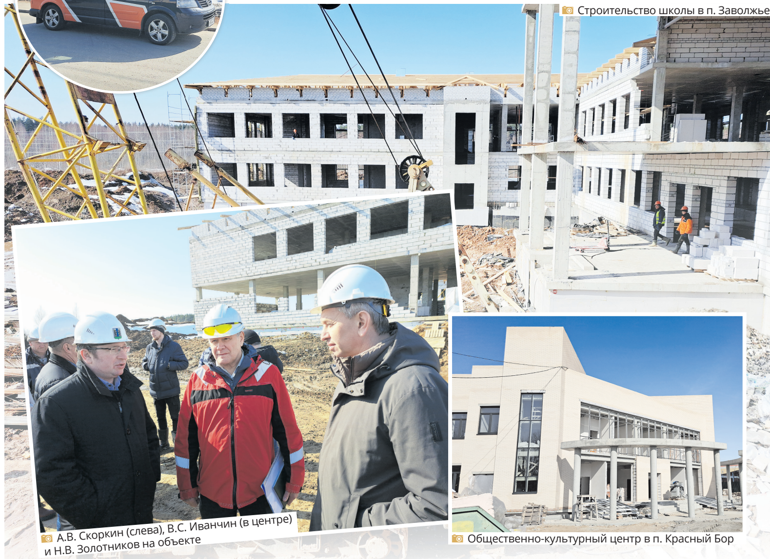
Строительство школы в п. Заволжье