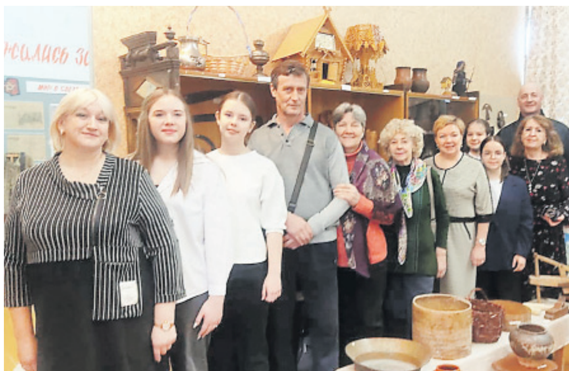
Экскурсия в музее Сарафоновской средней школы

В списке историко-культурных объектов для посещения в рамках районной туристско-патриотической акции «Путешествие по Ярославским предместьям», посвященной 95-летию ЯМР и Году семьи в РФ, есть храмовый ансамбль села Пажа и музей Сарафоновской школы.