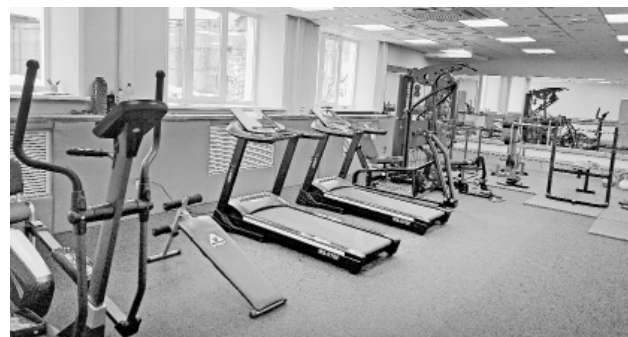
Тренажерный зал в п. Нагорный