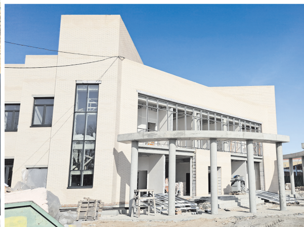
Общественно-культурный центр в п. Красный Бор